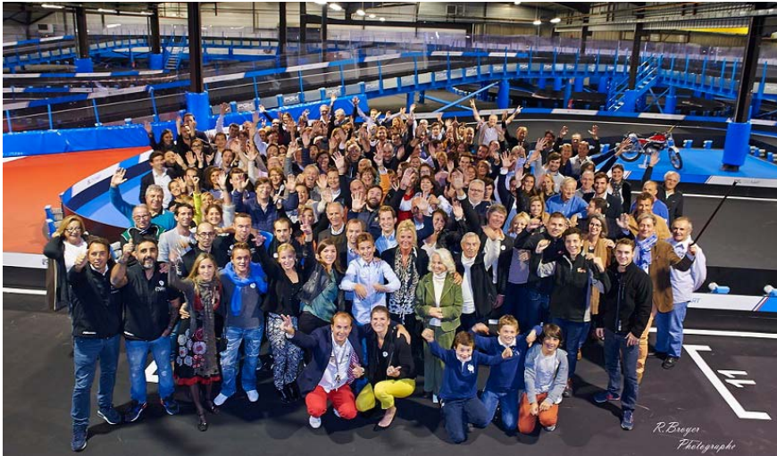
Ski indoor et karts électriques à seulement 20 minutes de Lyon !

01 NOV 2016 BY MARCO IN BUSINESS NEWS / 1 COMMENT