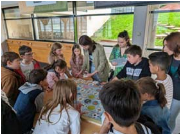
[Pédagogie] 150 enfants accueillis par nos élèves en GEE dans le cadre du dispositif «