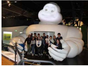
[Découverte] Nos 2e année FIMI sont allés partager un dernier