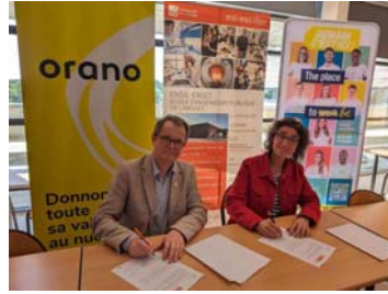
[Partenariat] Signature d'un accord